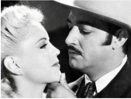
1945 CANAIMA (Canaima, el dios del mal) de Juan Bustillo Oro avec Jorge Negrete