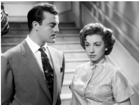
1953 L'INTRUSE (La Intrusa) de Miguel Morayta avec Eduardo Fajardo