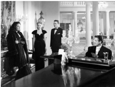
1946 LA DÉESSE AGENOUILLÉE (La diosa arrodillada) de R. Gavaldon avec Maria Felix, Arturo De Cordova