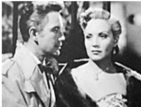
1954 DIEU NOUS ORDONNE DE VIVRE (Dios nos manda vivir) de Joaquin Pardavé avec Ramon Gay