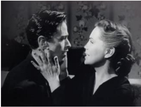
1952 UNE FEMME SANS AMOUR (Una Mujer sin amor) de Luis Buñuel avec Tinto Junco