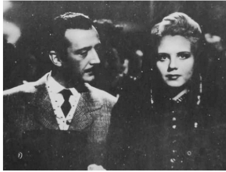
1945 TU ERES LA LUZ d'Alejandro Galindo avec Bernardo Sancristobal