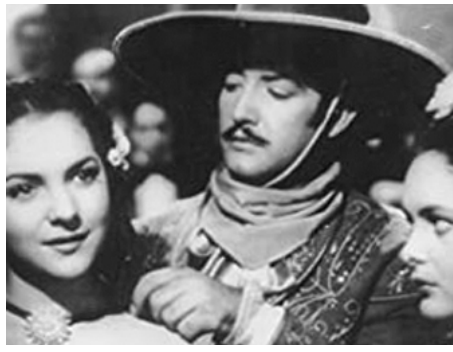
1944 LA ROUTE DE SACRAMENTO (Camino de Sacramento) de Chano Urueta avec Jorge Negrete