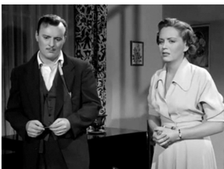
1956 LE MÉDAILLON DU CRIME (El Medallon del crimen) de Juan Bustillo Oro avec Manolo Fabregas