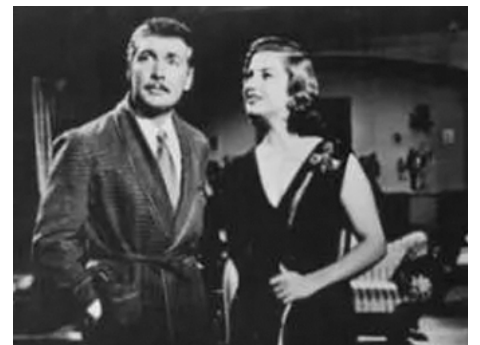
1955 LA FORCE DU DÉSIR (La Fuerza del deseo) de Miguel M. Delgado avec Armando Calvo