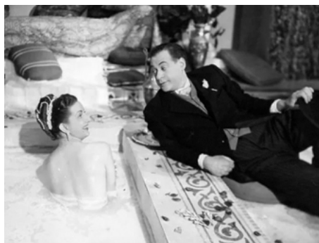
1949 LE BAIN D'APHRODITE (El baño d'Afrodita) de Tito Davison avec Raúl Guerrero