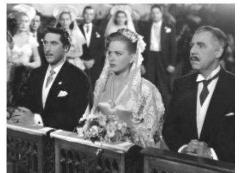
1949 LE GRAND NOCEUR (El gran Calavera) de Luis Buñuel avec Fernando Soler, Ruben Rojo