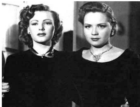
1948 SECRETS ENTRE FEMMES (Secreto entre mujeres) de Rafael Portillo avec Miroslava Stern