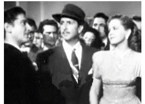
1948 LES AMOURS D'UNE VEUVE (Los amores de una viuda) de Julian Soler avec Carlos Riquelme