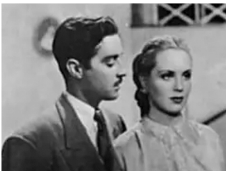
1949 ESCUELA PARA CASADAS de Miguel Zacarias avec Luis Aldas