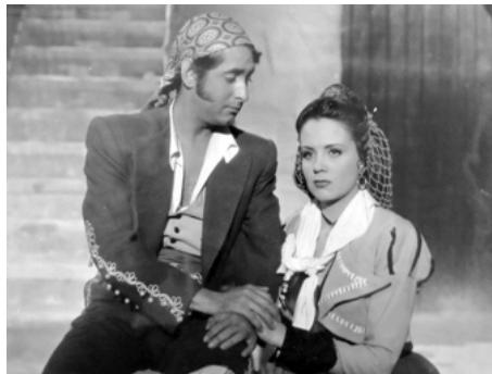
1947 LES SEPT FILS D'ECIJA (Los siete niños de Écija) de Miguel Morayta avec Julian Soler