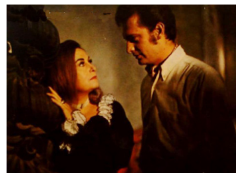
1971 LES VIERGES FOLLES (Las Virgenes locas) de Rogelio A. Gonzalez avec Enrique Lizalde