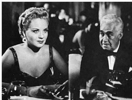
1955 PARA SIEMPRE, AMOR MIO de Tito Davison avec Domingo Soler